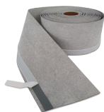
TAŚMA PROGOWA PL3 Z PASKIEM BUTYLU