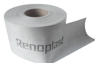
PL3 TAŚMA WZMACNIAJĄCA